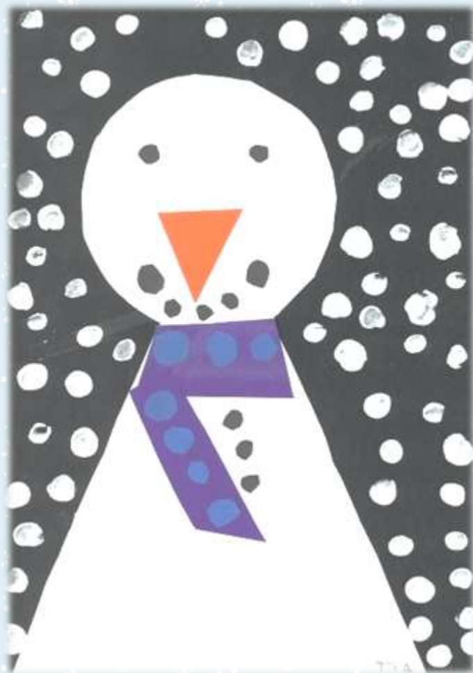
Snežak, Tia Vogrin, 1. a