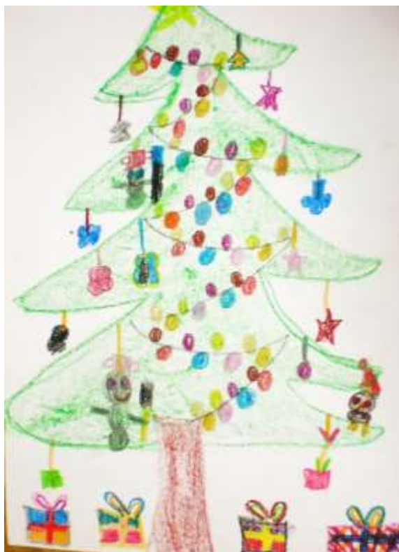
Tjaša Hanžel, 2. b