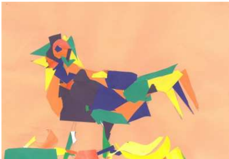
Mavrična ptica, Domen Kokol, 5. b