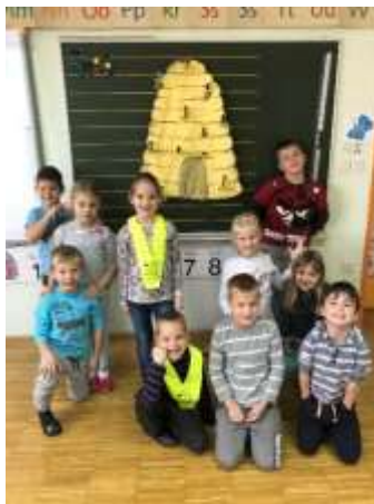
Čebele in med