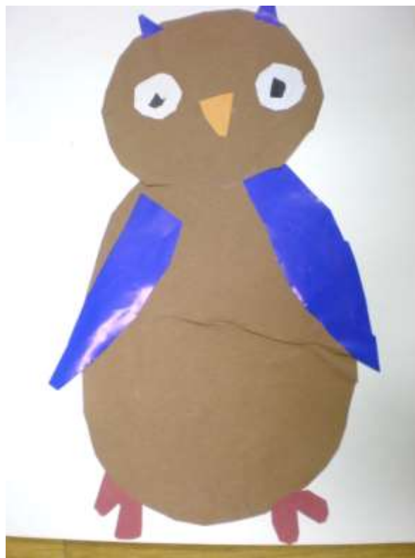
Tomaž Kokol, 2. b