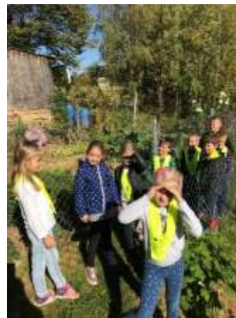
Učimo se – življenjski prostor vrt