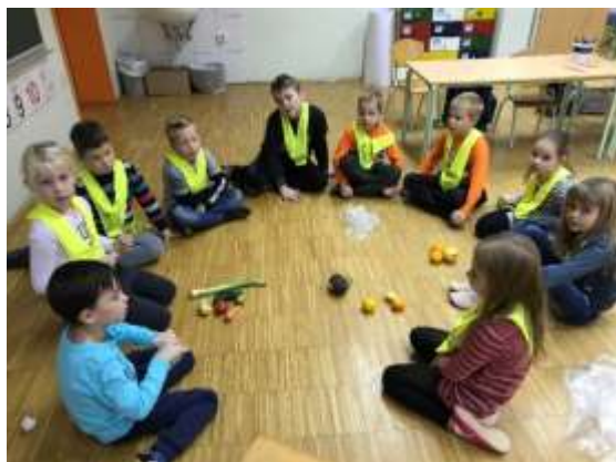
Učimo se – zelenjava