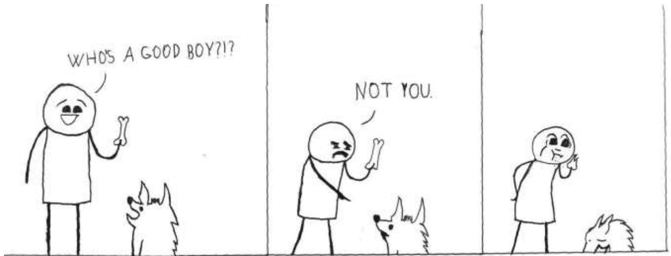
Strip, Mihael Vršič, 8. a