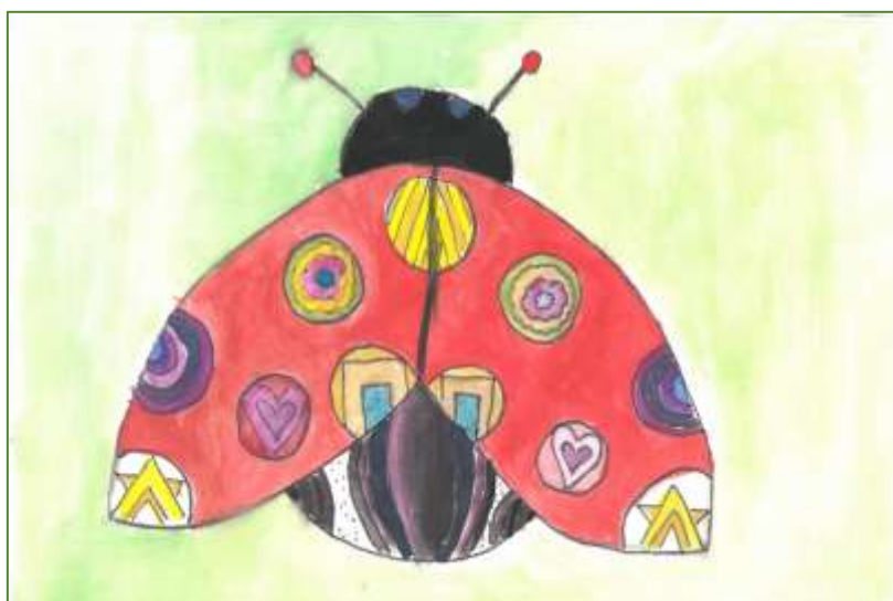
Pikapolonica, Sara Krepša, 5. b