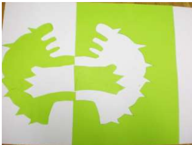
Tisa Korenjak, 2. b