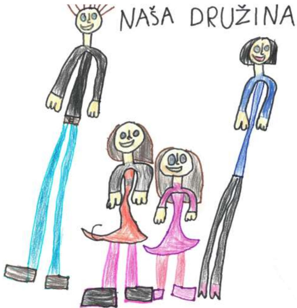
Náša družina, Urša Lorenčič, 1. a