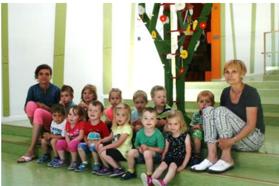
Vrtec Cerkvenjak 2. sk.