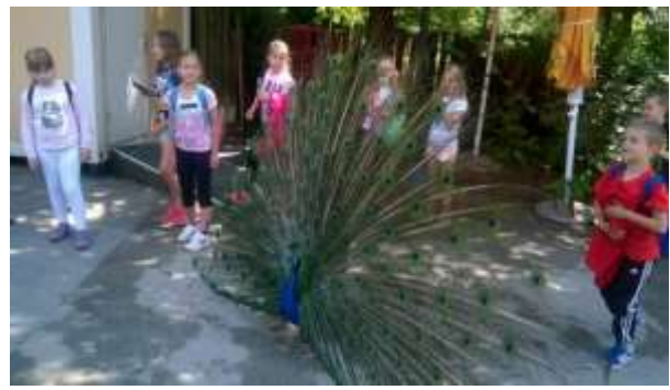
Učenci 2. in 3. b razreda