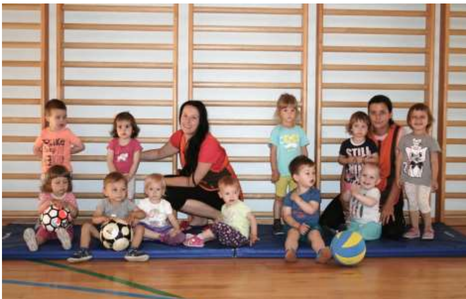
Vrtec Vitomarci 1. sk.