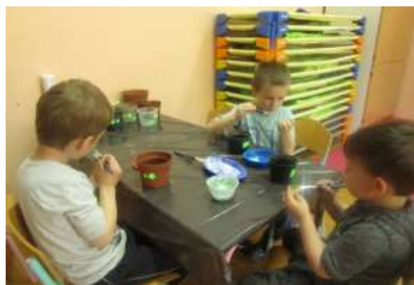
Izrezovali smo like in jih lepili na cvetlične lončke, v katere smo nato posejali baziliko, ki sedaj že uspeva na polici naših oken, kmalu pa si jo bodo otroci odnesli domov.