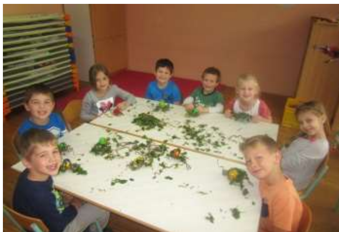
Pisanke so se bohotile v rožah in nato pristale v gnezdu spletenem in naravnih vejic krivorasle vrbe.