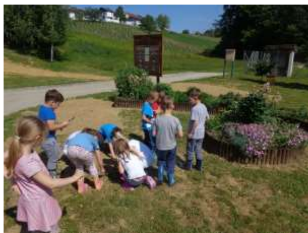
Radi smo raziskovali in podrobneje pod lupo opazovali ... črke, mravlje, pajke, rastline ...