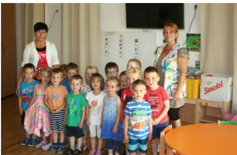
Vrtec Cerkvenjak 3. sk.