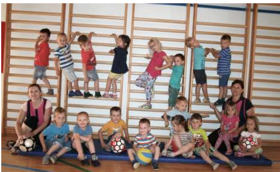
Vrtec Vitomarci 2. sk.