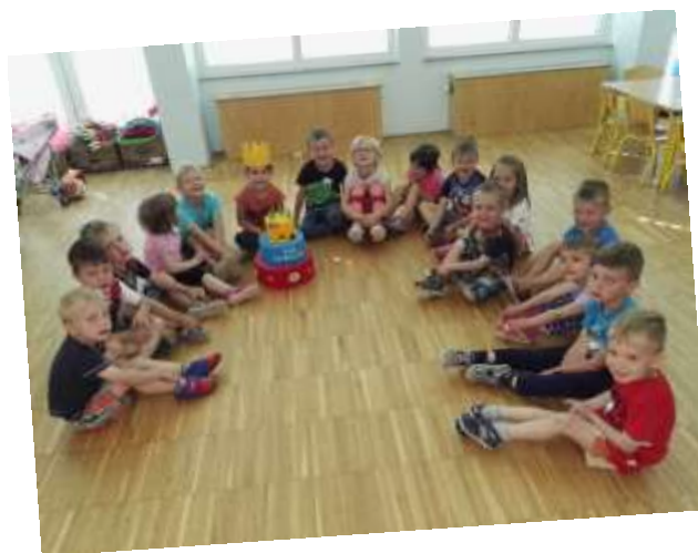
Praznovanje rojstnega dne