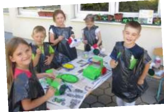
Kot ekomalčki smo si tudi traktorje izdelali iz odpadnih škatel in pokrovčkov