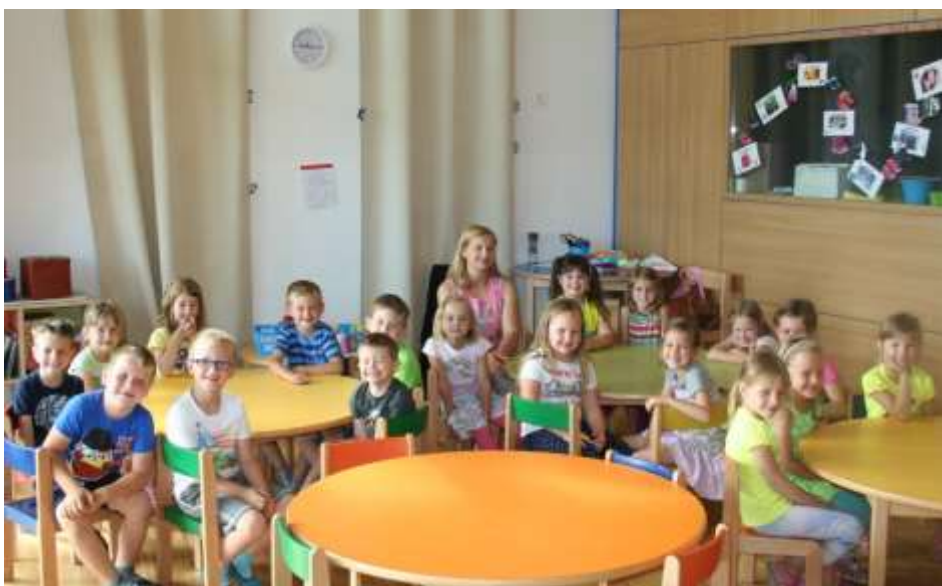
Vrtec Cerkvenjak 5. sk.