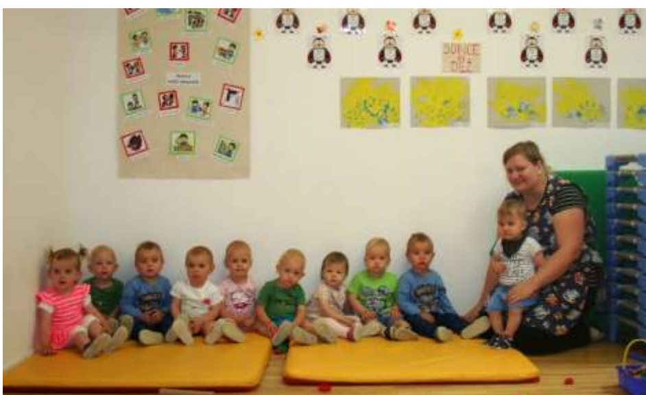
Vrtec Cerkvenjak 6. sk.