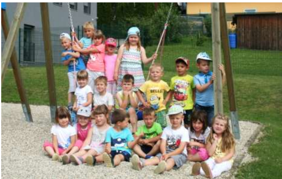
Vrtec Cerkvenjak 4. sk.