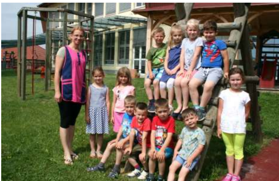
Vrtec Vitomarci 3. sk.