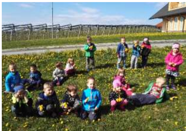
Nabiranje regratovih cvetov ter pihanje regratovih lučk