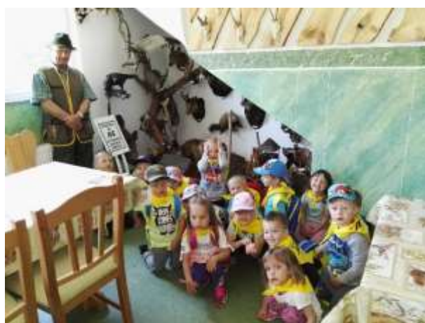
Pohod do Lovskega doma in ogled prepariranih živali