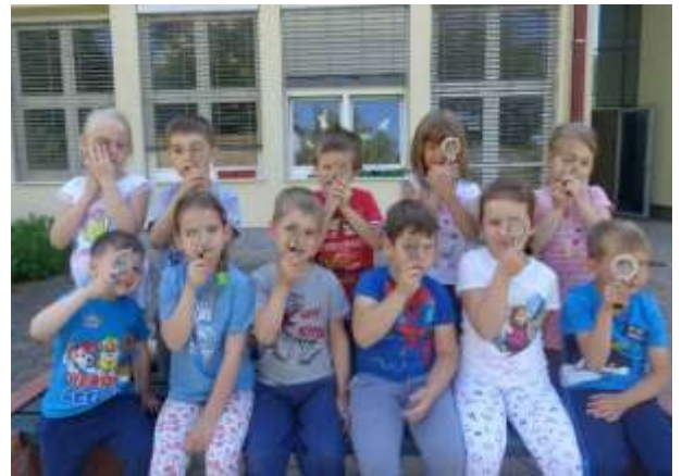
Kaj bomo, ko bomo veliki? Raziskovalci, frizerji, arhitekti ... Kdo ve ...