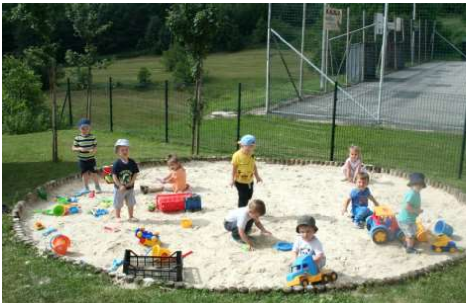
Vrtec Cerkvenjak 1. sk.