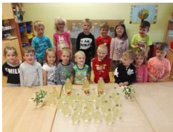
Nabrali smo bezgove cvetove in iz njih skuhalo bezgov sirup