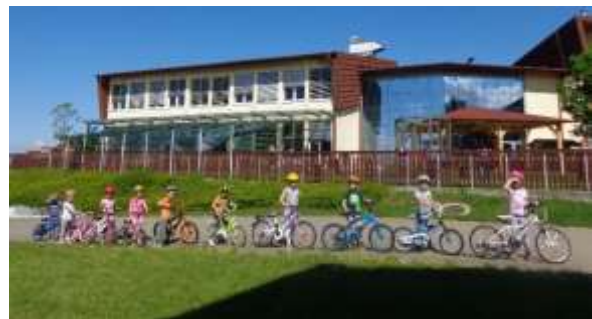
Kolona traktorjev in kolona kolesarjev